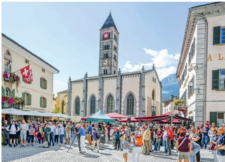
La cerimonia di consegna del Premio Wakker 2025 al Comune di Poschiavo (GR) si è svolta il 23 agosto.

Con il Premio Wakker, Patrimonio svizzero premia Comuni il cui lavoro esemplare può essere fonte d'ispirazione per altri borghi e città in Svizzera.