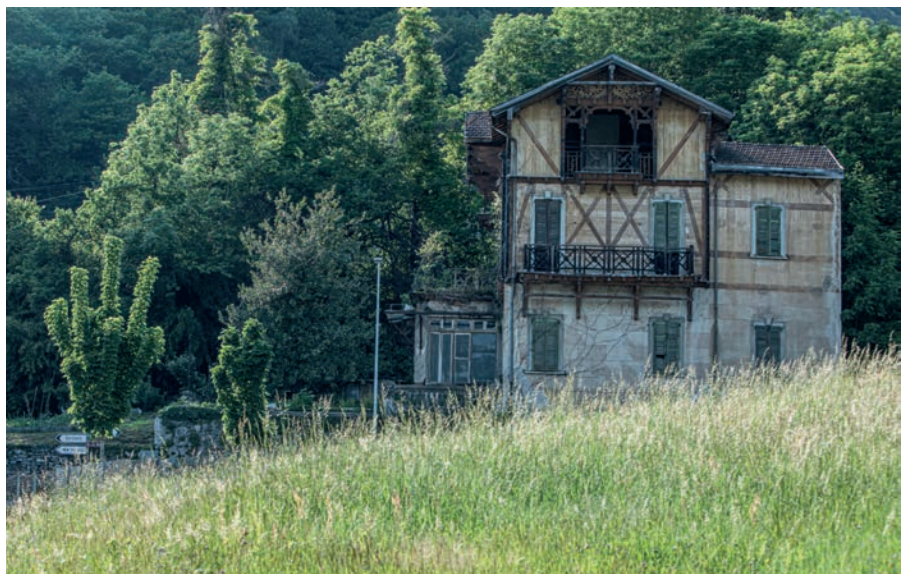
Uno degli oggetti presenti sulla piattaforma immobiliare Marché Patrimoine: la Villetta Trefogli a Torricella-Taverne (TI).