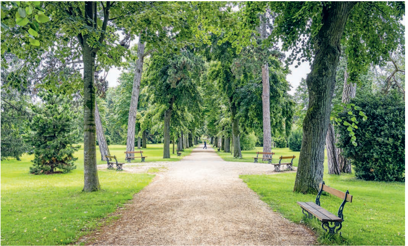
Il Kannenfeldpark ha valso a Basilea il Premio Schulthess per i giardini 2025.